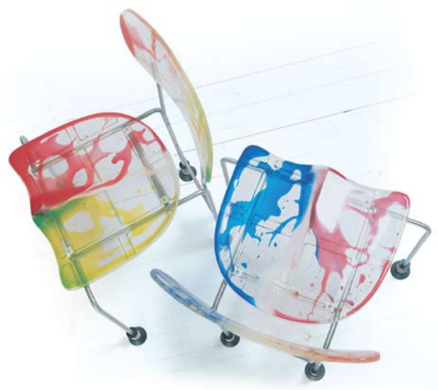
Bernini Cerano Laghetto, Milano - Italia | www.bernini.it

543 Broadway Sedia in acciaio inox con seduta e schienale in resina epoxidica e piedini a molle. Chair in stainless steel with seat and backrest in epoxy resin and spring feet. Design: Gaetano Pesce