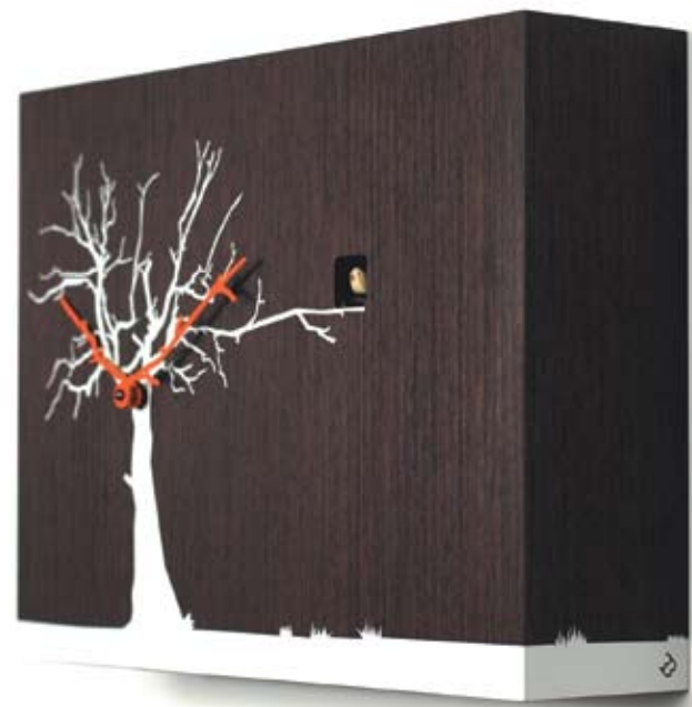
Progetti Carate Brianza, Milano - Italia | www.progettishop.it

CUCURAKO Orologio a quarzo realizzato in legno, movimento al quarzo a batteria. Cuckoo clock made in wood, battery quartz movement. Design: Riccardo Paolino e Matteo Fusi