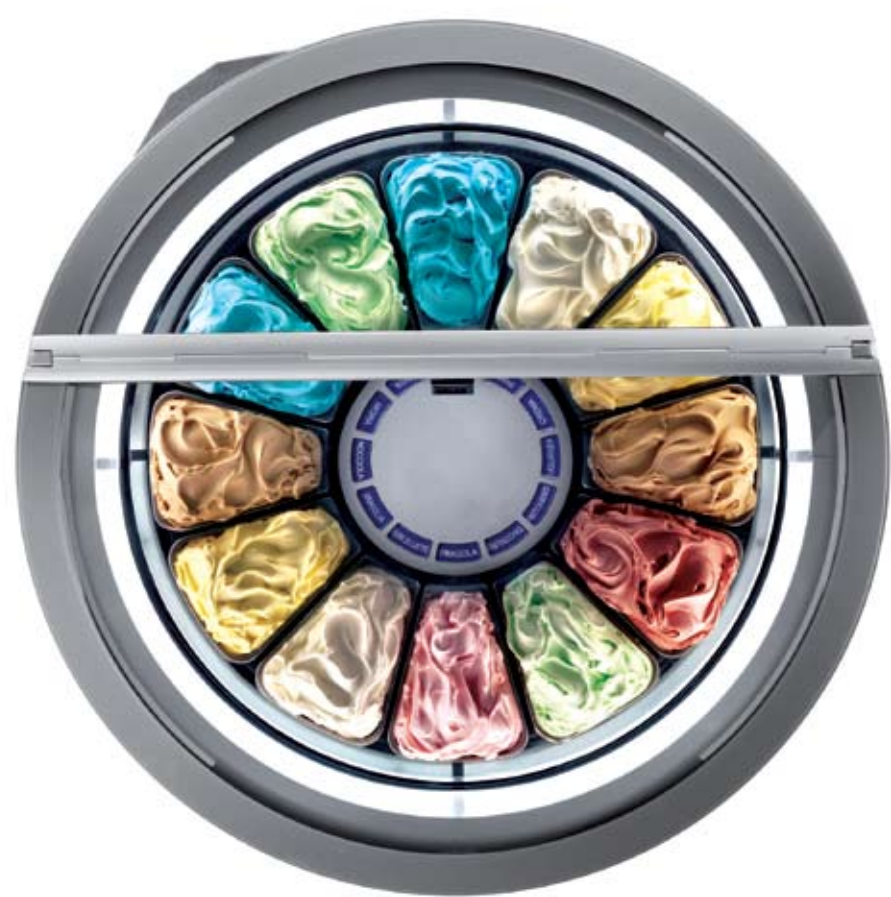
Ifi Tavullia, Pesaro - Italia | www.ifi.it

Tonda Vetrina per il gelato artigianale. Gelato display case. Design: Makio Hasuike con Ufficio Tecnico Ifi