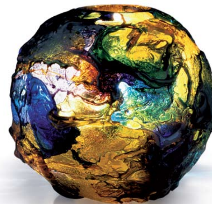
Venini Murano, Venezia - Italia | www.venini.com

Geocolor Vaso in vetro multicolore soffiato e lavorato a mano. Blown handworked vase made of coloured glass. Design: Gae Aulenti