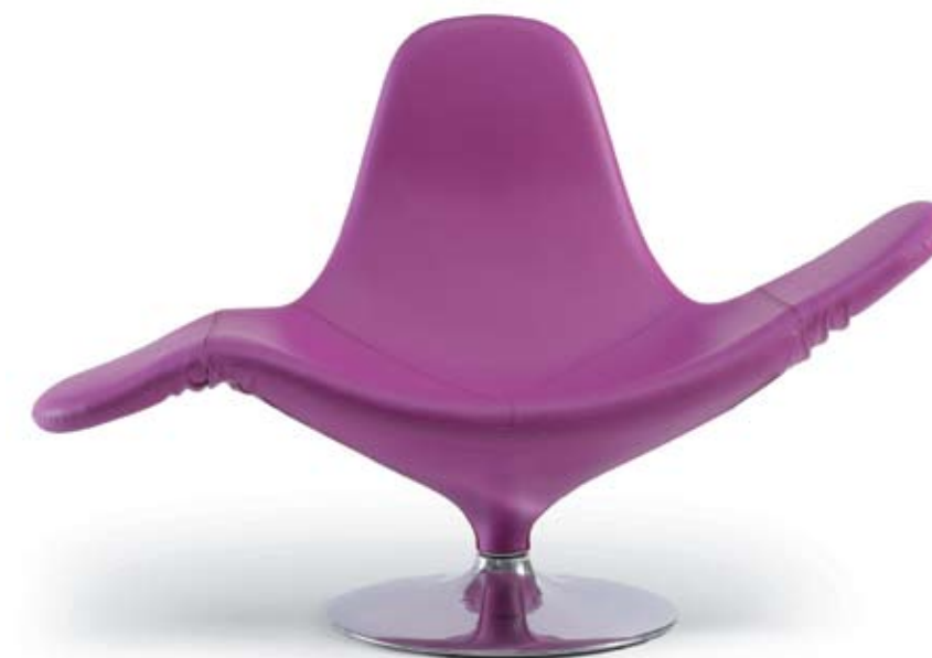
Domodinamica Osteria Grande, Bologna - Italia | www.zerozerodesign.it

Calla Poltrona con telaio interno in acciaio con poliuretano schiumato al freddo in stampo e sorretta da una base girevole in lega di alluminio lucidato. Ha la possibilità di trasformarsi in chaise longue. Armchair in polyurethane resin cold foamed with iron structure inside, supported by a rotating base in polished aluminium alloy. Offers the possibility to be transformed in chaise longue. Design: Stefano Giovannoni