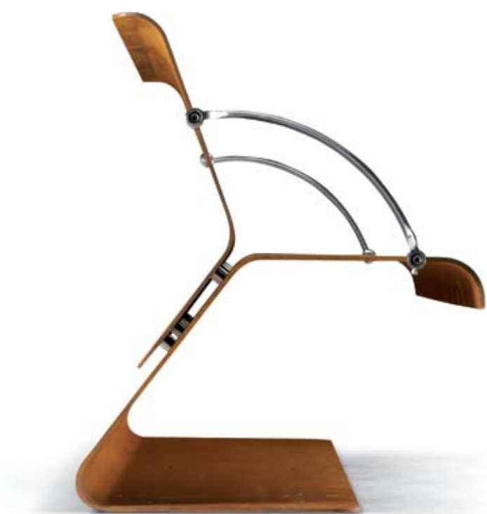
Metalco Castelmio di Resana, Treviso - Italia | www.metalco.it

CUCURAKO Orologio a quarzo realizzato in legno, movimento al quarzo a batteria. Cuckoo clock made in wood, battery quartz movement. Design: Riccardo Paolino e Matteo Fusi