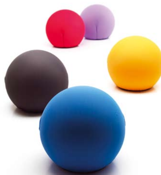
Cerruti Baleri Milano - Italia | www.cerrutibaleri.com

Tatino Seduta elastica o poggiatesta, realizzato in poliuretano flessibile ed ecologico con struttura interna anatomica. Sitting elastic or footrest, made of flexible polyurethane with internal structure and ecological anatomy. Design: Riccardo Schweizer