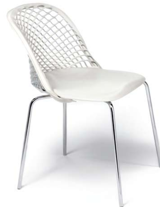
Matteograssi Mariano Comense, Como - Italia | www.matteograssi.it

Zoe Poltroncina in rete di cuoio con struttura in acciaio cromato. Small armchair in coach hide with patented cutting. Chrome steel structure. Design: Franco Poli