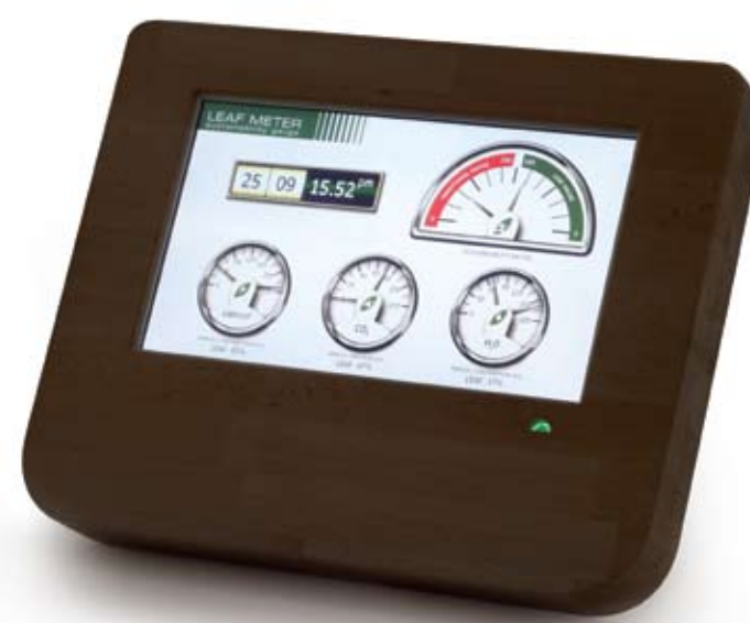
Loccioni Angeli di Rosora, Ancona - Italia | www.loccioni.com