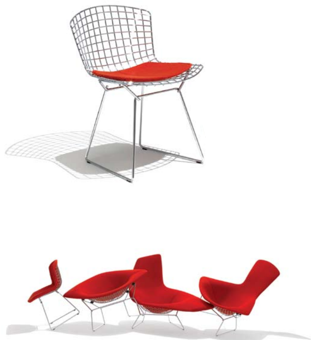
Knoll Milano - Italia | www.knoll-int.com

Bertola Serie di sedute con struttura in tondino di acciaio cromato con cuscino rosso. Series of sessions with structure in rod-plated steel with red cushion. Design: Harry Bertola