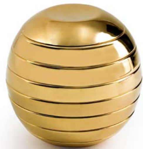
Bosa Borso del Grappa (TV), Italia | www.bosatrade.com

Giulietta e Romeo Set di piatti. Set of dishes. Design: Riccardo Schweizer