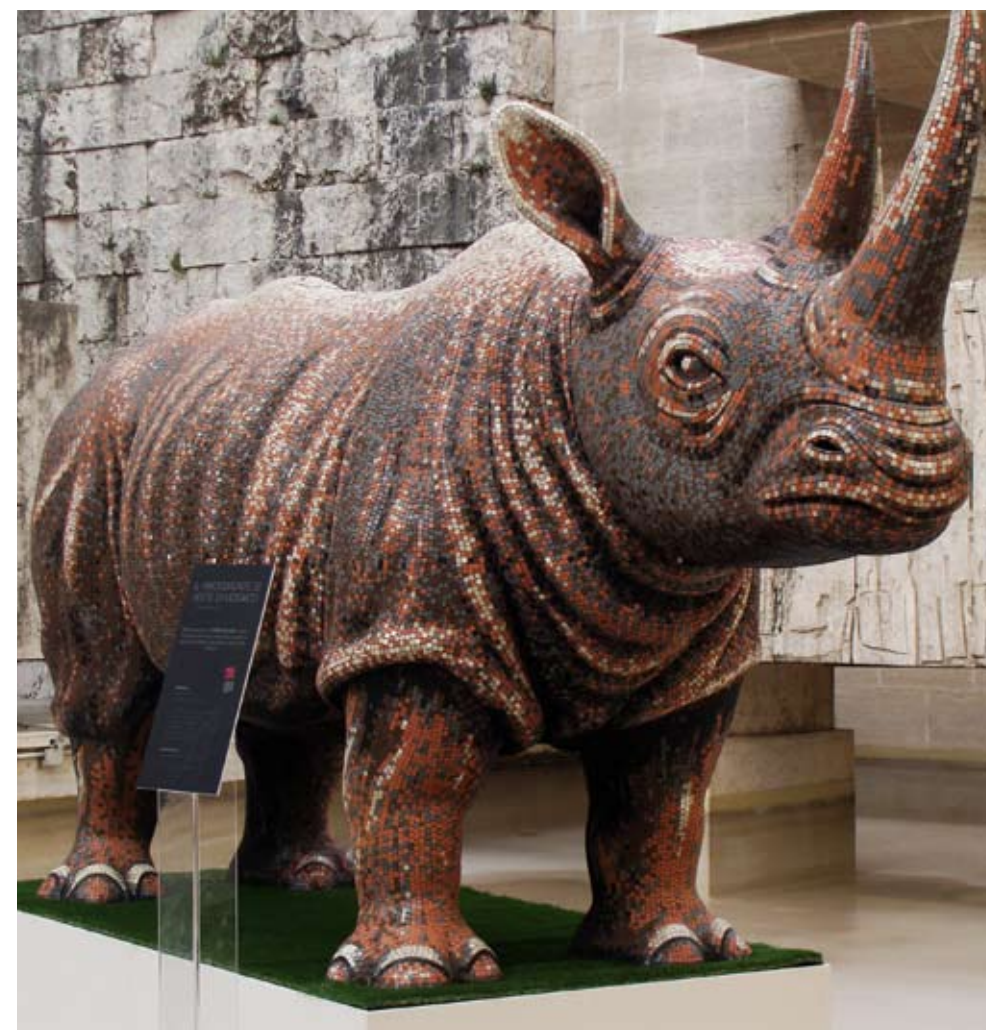
Stone Italiana Zimella, Verona - Italia | www.stoneitaliana.com

Rinoceronte Scultura RINOCERONTE rivestita in tessere di mosaico artistico in quarzo. Artistic quartz mosaic tiles coated RINOC sculpture. Design: Gae Aulenti